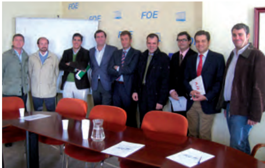
Miembros de la Junta Directiva de AJE-Huelva

Es la propia Asociación la encargada de gestionar y coordinar la tramitación de los préstamos, siendo el plazo de respuesta no superior a unos dos meses. Los emprendedores que estén interesados deberán hacerlo antes del día 2 Diciembre se cierra provisionalmente el plazo de presentación de proyectos.